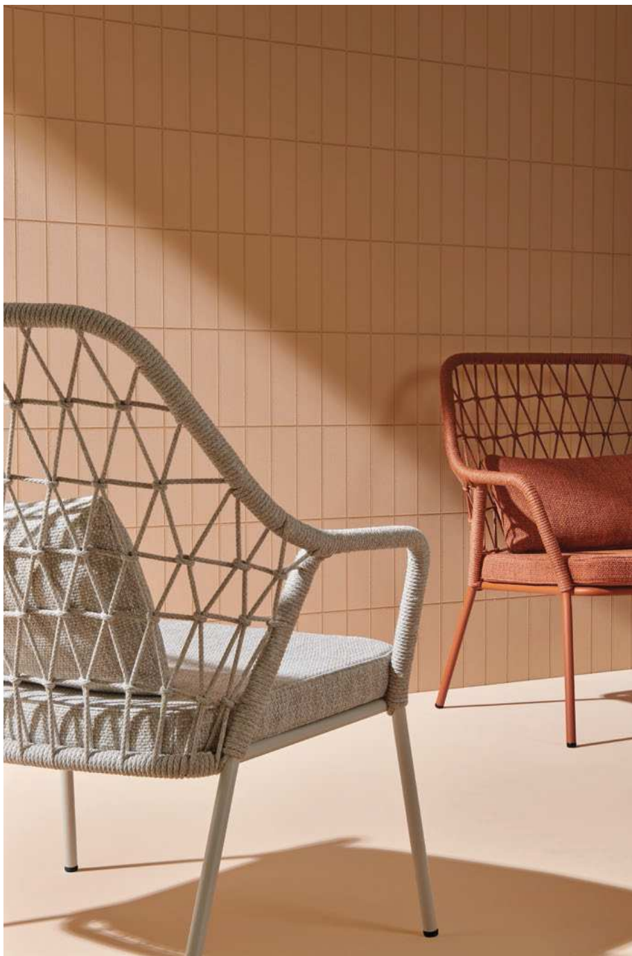
panarea lounge Art. 3679

The lounge armchair comes with a wide seat and a high backrest. La poltrona lounge è dotata di una seduta molto generosa e di uno schienale alto.