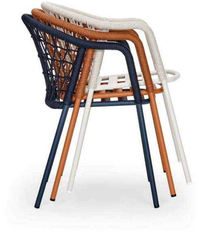
panarea armchair Art. 3675

Stackable armchair up to five pieces. Poltrona impilabile fino a cinque pezzi.