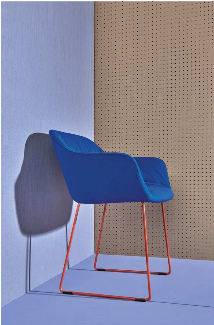
babila XL Art. 2743R

Upholstered armchair, removable covering. Ø 11 mm steel rod sled frame. Poltrona imbottita sfoderabile. Gambe a slitta in tondino Ø 11 mm.