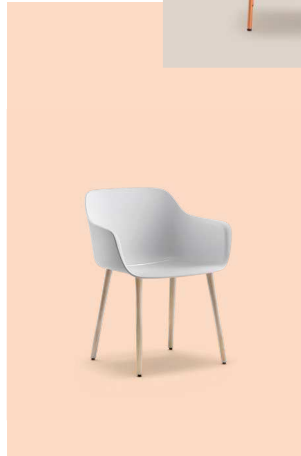
babila XL Art. 2734 Art. 2754

Polypropylene shell available in white, sand, black or recycled grey. Scocca in polipropilene disponibile in bianco, sabbia, nero o recycled grey.