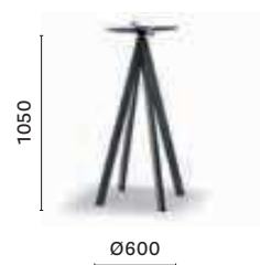
Table base, four steel legs