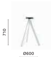
Table base, three steel legs