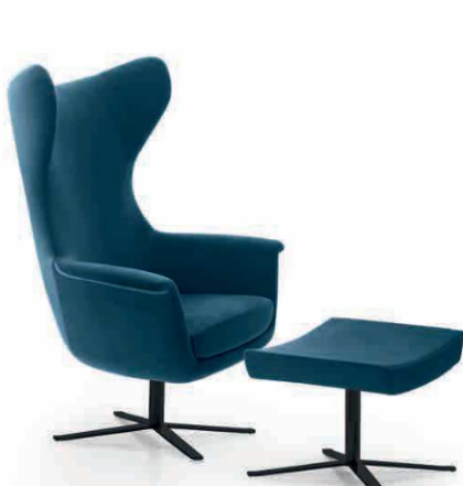
FAY/R13 BLACK ARMCHAIR ANCHE CROMO ALSO CHROMED