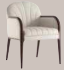
Parigi 038 PO