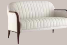
Parigi 038 D