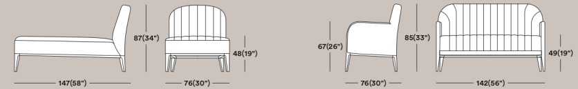
Parigi 038 CL