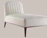
Parigi 038 CL