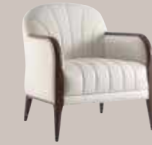
Parigi 038 P