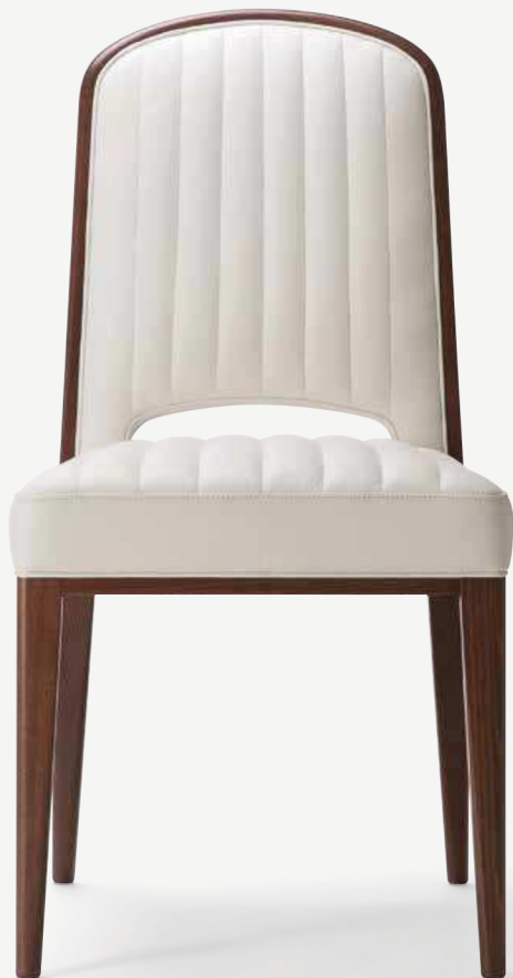
01. Parigi 038 SA