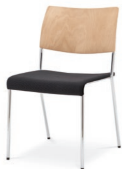
Modell 8021: Buche natur, Sitzpolster