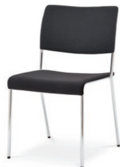
Modell 8022: Sitz- und Rückenpolster