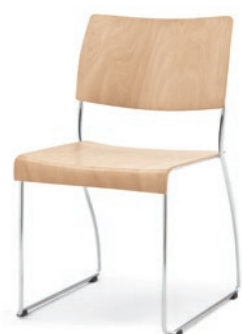
Modell 8010: Buche natur, ungepolstert