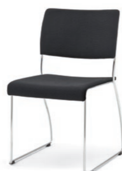
Modell 8012: Sitz- und Rückenpolster