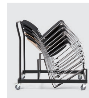
Modell 1035: Stapelwagen