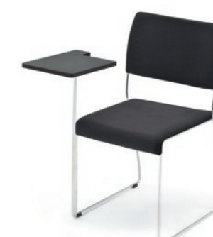
Modell 8012: Sitz- und Rückenpolster, mit Schreibtisch