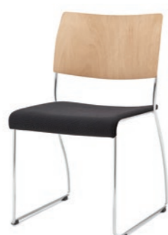
Modell 8011: Buche natur, Sitzpolster