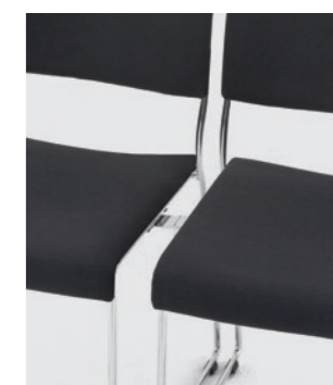
Modell 8012: Sitz- und Rückenpolster, mit Schiebe- Reihenverbindung