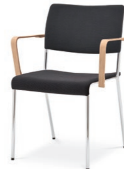
Modell 8022/A: Sitz- und Rückenpolster, Armlehnen Buche natur