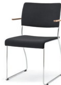
Modell 8012/A: Sitz- und Rückenpolster, Armlehnen Buche natur