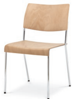
Modell 8020: Buche natur, ungepolstert