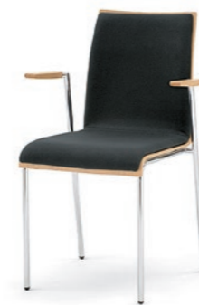
Modell 3023/A: Polsterdoppel, Armlehnen Buche natur