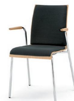
Modell 3012/A: Buche natur, Sitz- und Rückenpolster, Armlehnen Buche natur