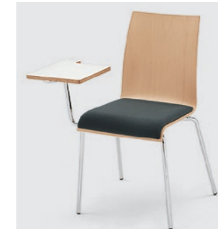
Modell 3011: mit Schreibtisch