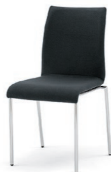
Modell 3024: Vollpolster