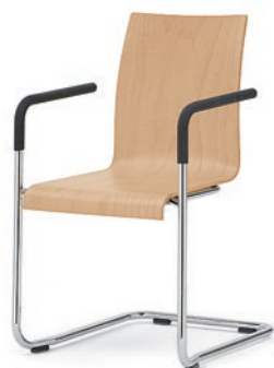
Modell 3040/A: Buche natur, ungepolstert