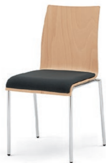
Modell 3021: Buche natur, Sitzpolster