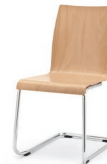
Modell 3040: Buche natur, ungepolstert