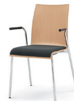
Modell 3011/A: Buche natur, Sitzpolster, Armlehnen mit Soft-Grip-Schlauch