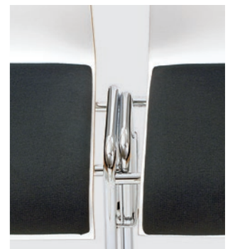
Detail: Integrierte Reihenver- bindung