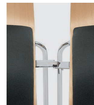
Modell 3031: Buche natur, Sitzpolster, mit Schiebe- Reihenverbindung Nr. 2