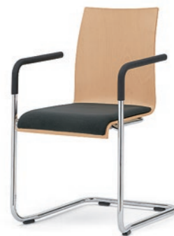
Modell 3041/A: Buche natur, Sitzpolster