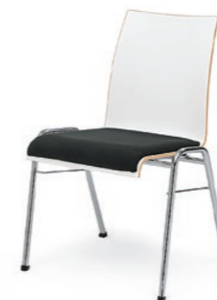
Modell 3091-1: Sitzschale Buchenschichtholz weiß laminiert, Sitzpolster

Modell 3060: Barhocker mit niedriger Rückenlehne Modell 3070: Barhocker mit hoher Rückenlehne Modell 3039: Bartisch