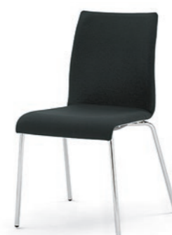
Modell 3014: Vollpolster