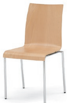
Modell 3020: Buche natur, ungepolstert