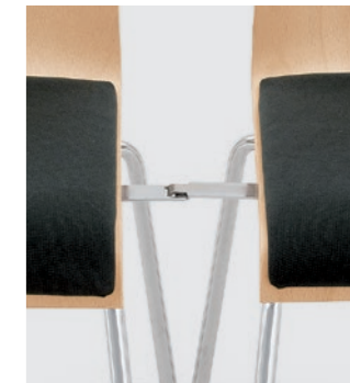
Modell 3011: Buche natur, Sitzpolster, mit Schiebe-Reihenverbindung Nr. 2