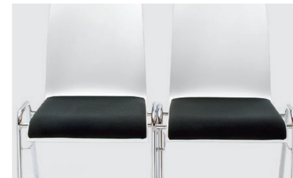
Modell 3091-2: Gestell mit integrierter Reihenver- bindung

Modell 3091-6: Stühle in Bankformation mit integrierter Reihenverbindung. Gestell: Rundrohr Ø 20 x 1,5 mm, verchromt, Sitzschale aus Buchenschichtholz natur lackiert, gebeizt, mit Edel-Deckfurnier oder mit Laminat in verschiedenen Farben, Polster in verschiedenen Ausführungen erhältlich.