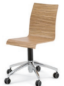
Modell 3050: Drehstuhl mit Aluminiumfußkreuz poliert