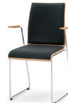
Modell 3032/A: Buche natur, Sitz- und Rückenpolster, mit Armlehnen Buche natur