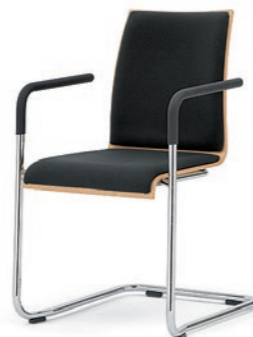
Modell 3042/A: Buche natur, Sitz- und Rückenpolster