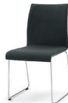
Modell 3034: Vollpolster