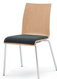
Modell 3011: Buche natur, Sitzpolster