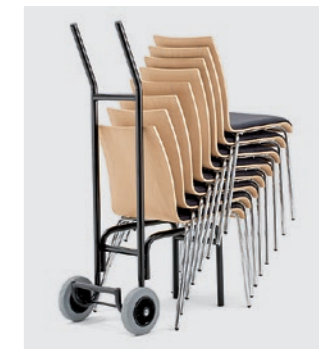
Modell 1036: Stuhlkarre