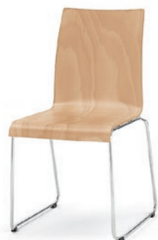
Modell 3030: Buche natur, ungepolstert

Modell 3030: Stapelstuhl, Gestell aus Vollstahl, ø 12 mm, verchromt, Sitzschale aus Buchenschichtholz, natur lackiert, gebeizt, mit Edel-Deckfurnier oder mit Laminat in verschiedenen Farben. Polster in verschiedenen Ausführungen erhältlich.