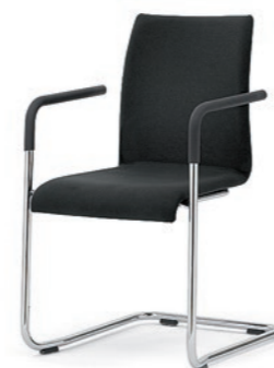
Modell 3044/A: Vollpolster