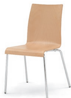
Modell 3010: Buche natur, ungepolstert