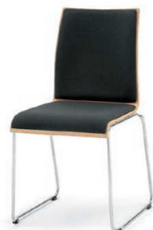
Modell 3032: Buche natur, Sitz- und Rückenpolster