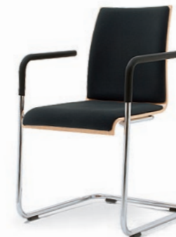
Modell 3042-NS/A: Buche natur, Sitz- und Rückenpolster, nicht stapelbar