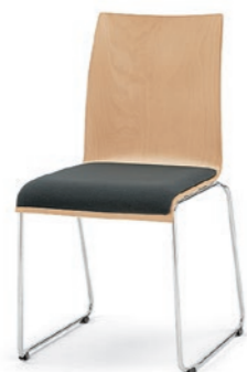
Modell 3031: Buche natur, Sitzpolster