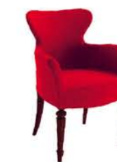
Geisha 1640 PO GT2 * Dimensioni / Sizes