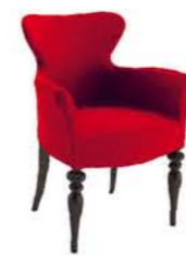
Geisha 1640 PO GT3 * Dimensioni / Sizes