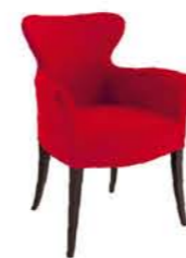
Geisha 1640 PO GS Dimensioni / Sizes

Scocca / Shell Poliuretano / Polyurethane Base / Base Faggio / Beech