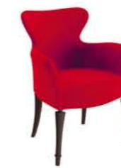
Geisha 1640 PO GT1 * Dimensioni / Sizes