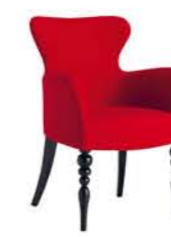
Geisha 1640 PO GT4 * Dimensioni / Sizes